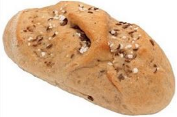
Dalamánek chlebový 70g