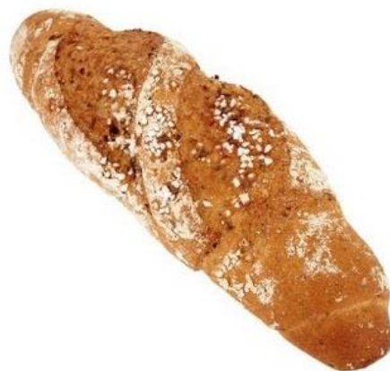
Kornspitz XXL 120g