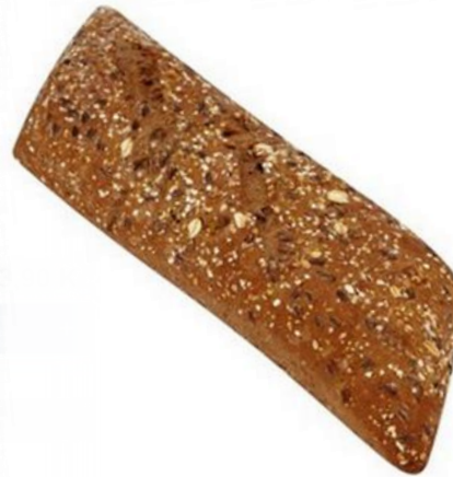
Rustikální bageta pohanka 120g