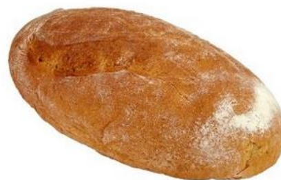
Chléb konzumní 1200g